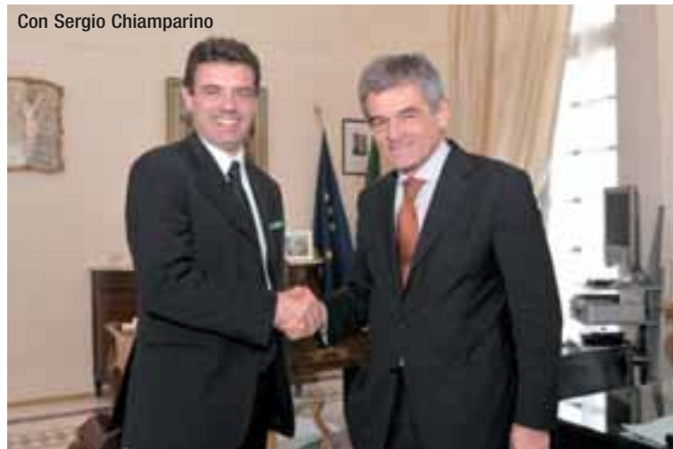
Con Sergio Chiamparino