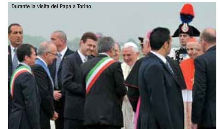
Durante la visita del Papa a Torino

«Penso che le celebrazioni per il centocinquantesimo anniversario dell'Unità d'Italia avranno veramente un senso se lo Stato viene declinato al futuro. Quindi se viene declinata l'idea di uno Stato moderno e di uno Stato federale