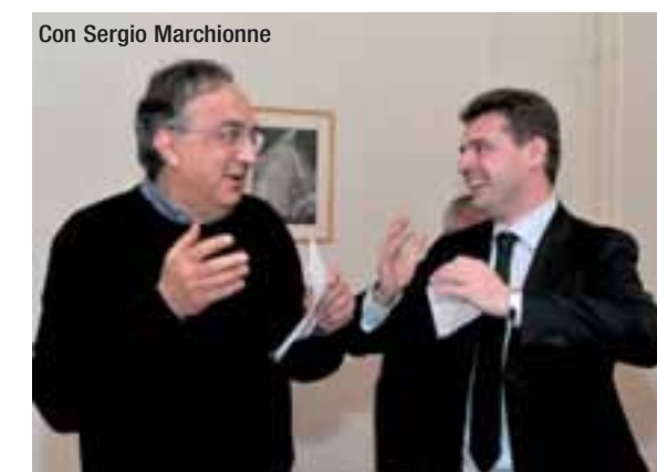
Con Sergio Marchionne

«Certo, ma bisogna comportarsi da persone normali. Io vado tra la gente perché mi ritengo una perso-