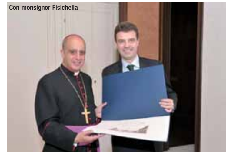
Con monsignor Fisichella