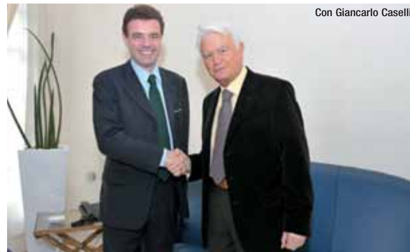
Con Giancarlo Caselli