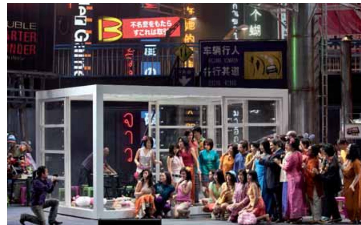
'Madama Butterfly' di Giacomo Puccini

re veicolando contenuti espressivi – la riflessione sarcastica sulla natura umana, la constatazione dei limiti delle convenzioni sociali – di ben altra profondità rispetto agli standard dell'opera comica all'italiana; in regia un nome di richiamo come Ettore Scola mentre sul podio troviamo Christopher Franklin, che dirige alcu-