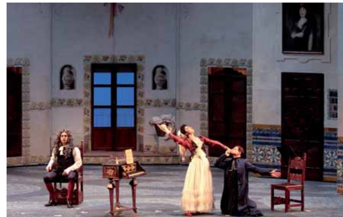
A sinistra e al centro: 'Il barbiere di Siviglia' di Gioachino Rossini