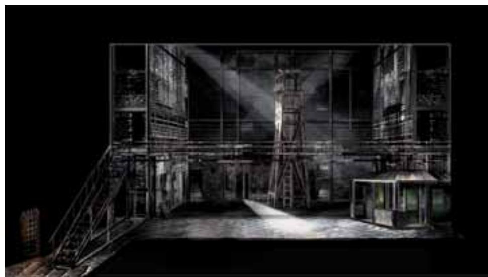
'Fidelio o l'amor coniugale' - bozzetto di Sergio Tramonti

A lato da sinistra: Gianandrea Noseda; 'Tosca' di Giacomo Puccini