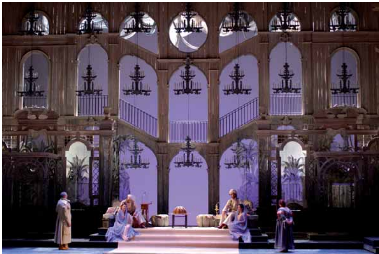
'Così fan tutte' di Wolfgang Amadeus Mozart